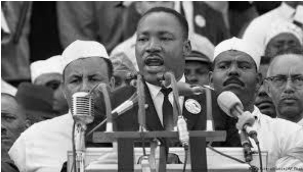
Martin Luther King