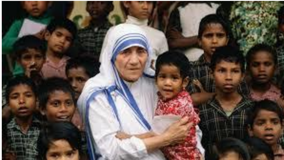
Madre Teresa de Calcutá