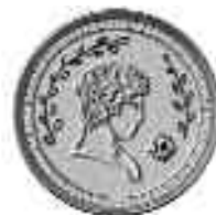
Leão Protegé Distintivo de Lapela

Quando o secretário do clube receber o Relatório de Realização preenchido, ele deverá notificar as partes competentes para providenciarem o reconhecimento do clube e a celebração do seu sucesso continuado. Aproveite esta oportunidade para falar das suas experiências com o Programa Leonístico de Mentor e do seu desenvolvimento como um Leão. Além de celebrar com o seu clube, as suas realizações serão homenageadas em nível de distrito.