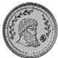
Leão Mentor Distintivo de Lapela

Os Leões mentores e protegés bem-sucedidos são contemplados com o elegante distintivo de lapela abaixo figurado, acompanhado dos certificados de realização. Estes prêmios conferem o reconhecimento merecido sobre os Leões verdadeiramente especiais.